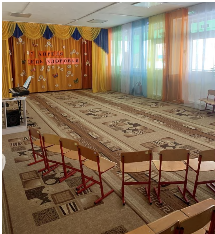
Фото № 19