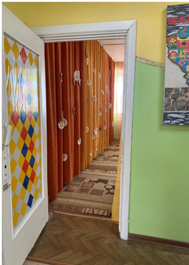
Фото № 15