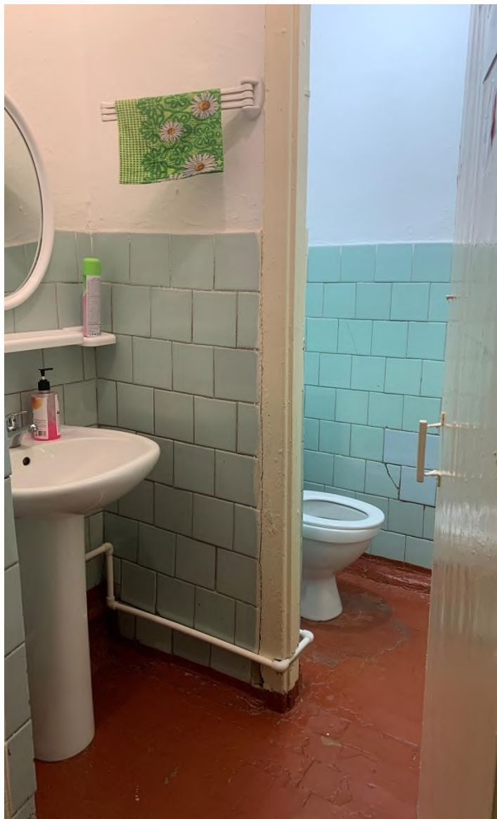
Φοτο Νο 21