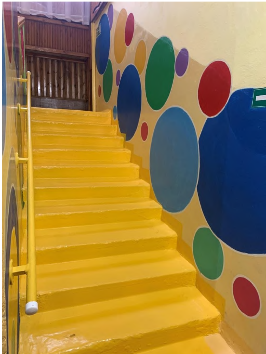
Фото № 13