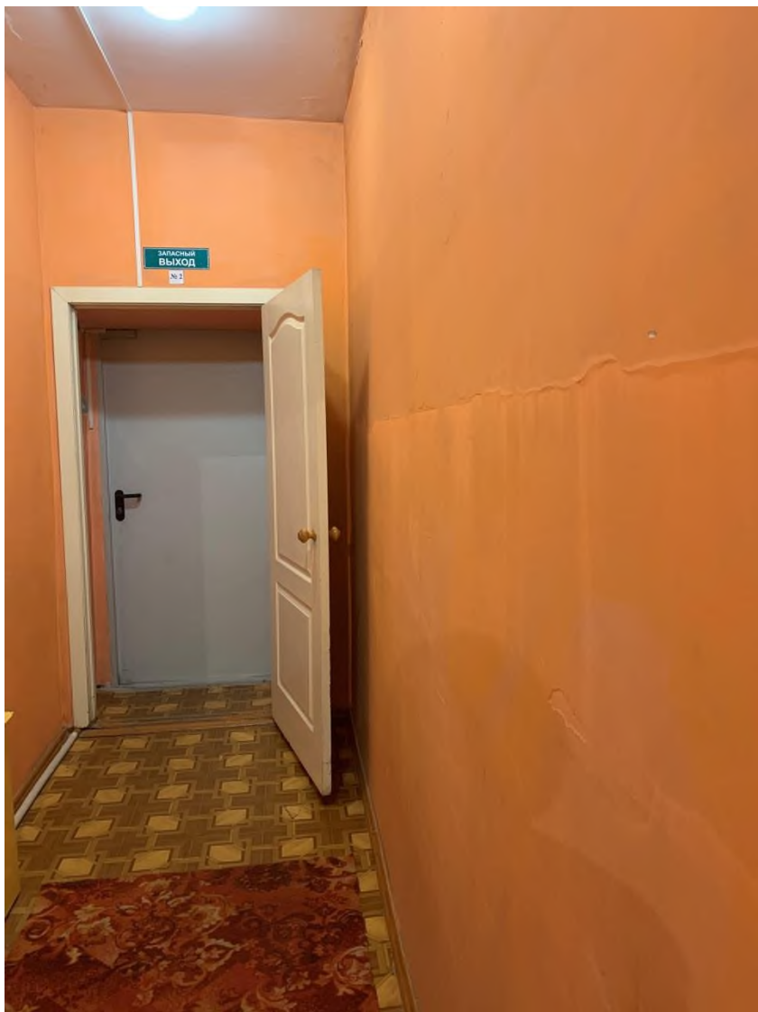
Фото № 11