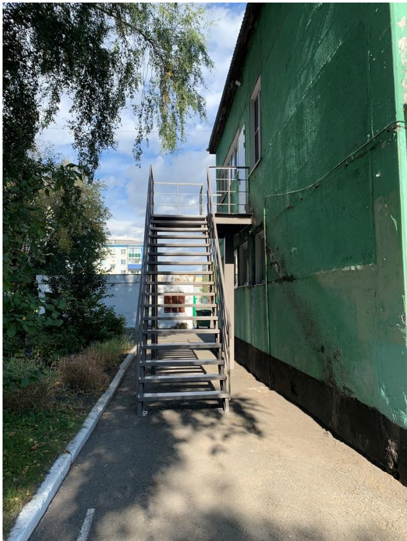
Фото № 17